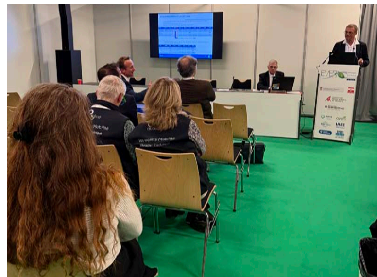
Conférences se déroulant au Grimaldi Forum en 2024